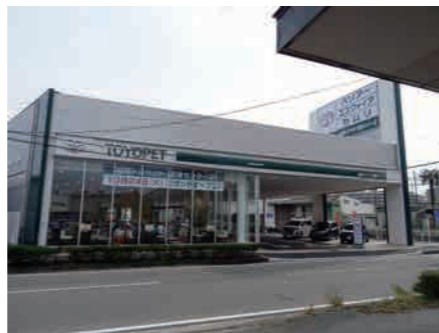
リニューアルオープンされたショールームです!