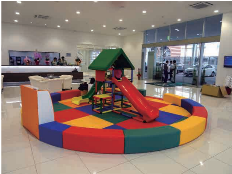
【納入年月】平成29年11月7日 【全体サイズ】φ5000mm