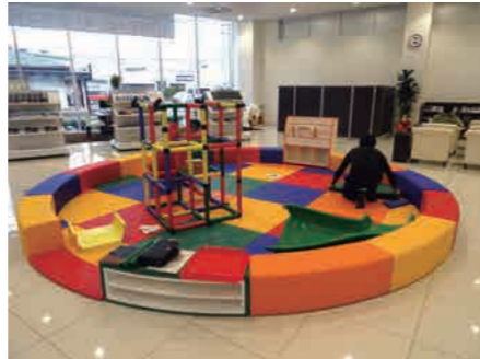
こんな感じで作業していますよ!

福岡トヨペット様ではおなじみとなりました、サークルタイプのキッズコーナー。広いショールームの中でも存在感があるφ5000mmのサイズです。ショールームの中心に設置される事で親御様、スタッフ様などの目が行き届き、子ども達にとって安心して遊んで頂く事が出来ます。大型のジャングルジムは社長が事前に準備して持ち込みした為、スムーズに完成。2種類あるスライダーでもおもしろい遊びで頂けます☆