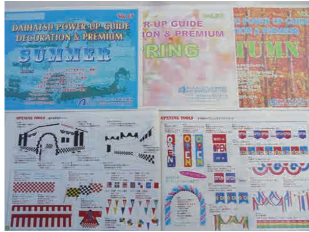
パワーアップガイド